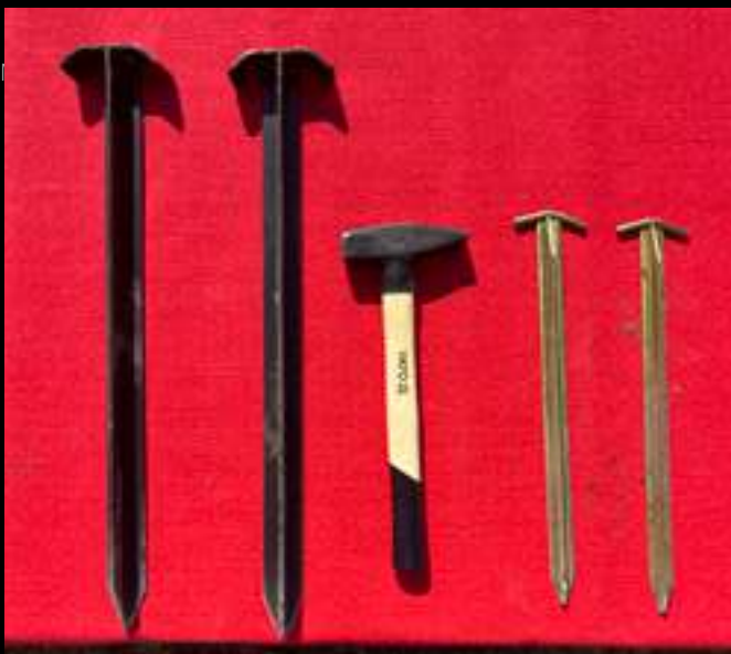
piquets d'ancrage pour la fixation de la sculpture

Ventilateur intégré (soufflerie silencieuse) Fonctionnement en pression continue : nécessite une alimentation électrique constante La sculpture conserve sa forme et sa rigidité grâce à l'air en pression permanente